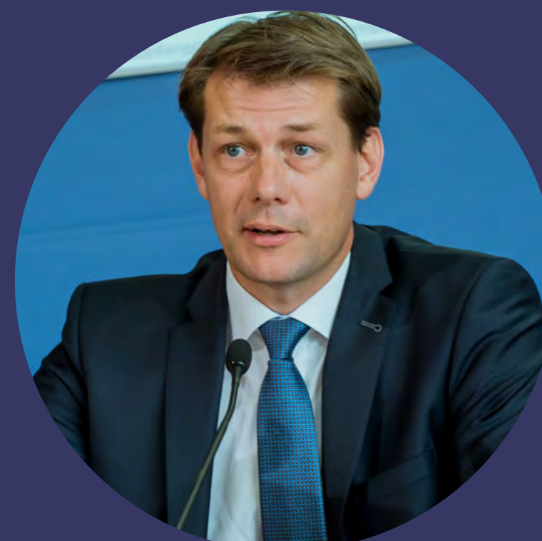
GUIDO ZÖLLICK, Dehoga-Präsident, zu den Corona-Hilfsprogrammen der Regierung.

»Das aktuelle Hilfschaos und die kaum noch zu überbietende Komplexität müssen beseitigt werden.«