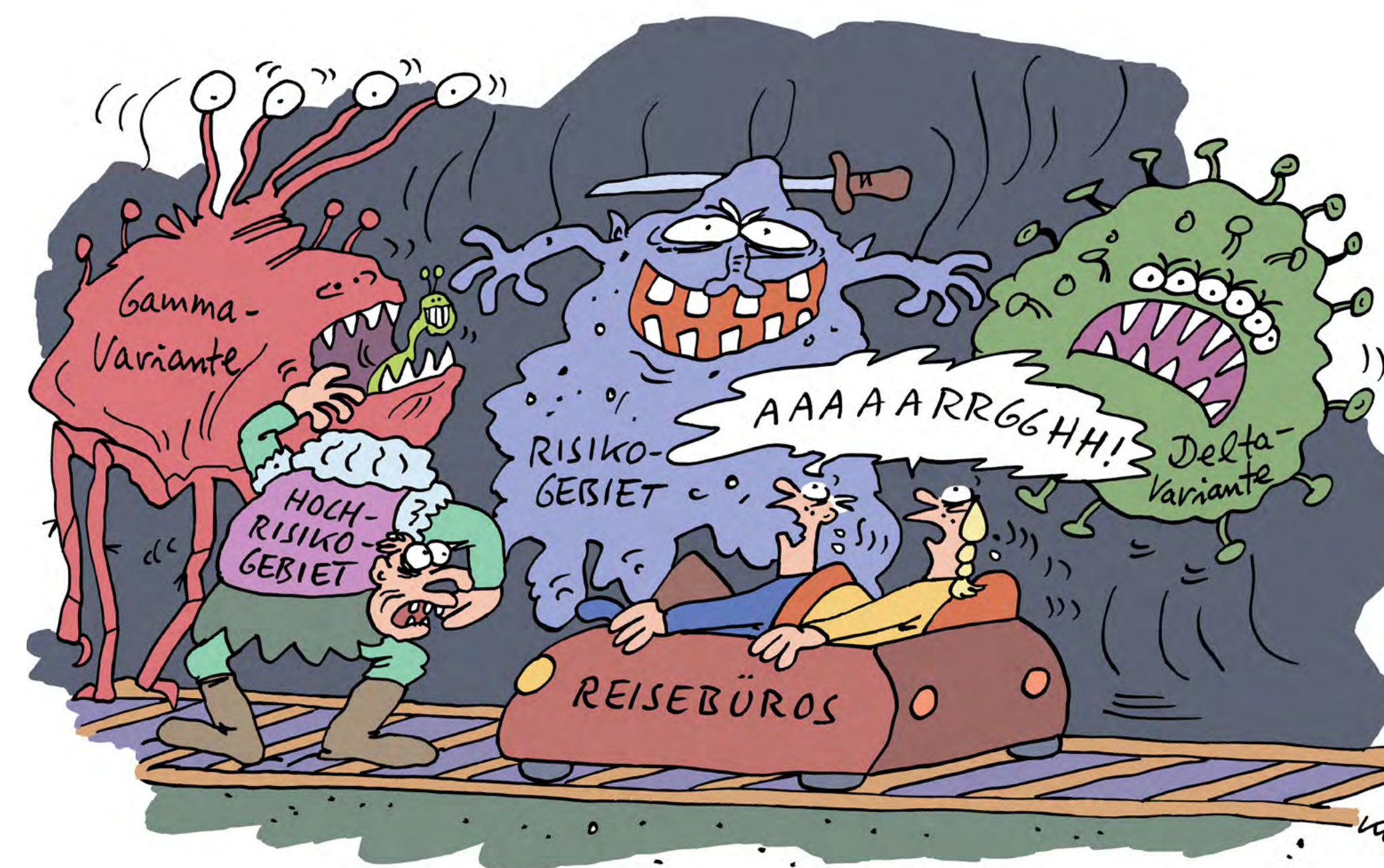
Neulich, in der Geisterbahn