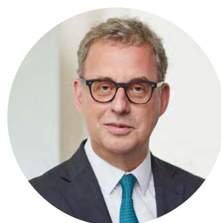
DRV-Präsident Norbert Fiebig

Die Inselgruppe der Kanaren sowie andere Regionen Spaniens wie Katalonien sind von Sonntag an kein Hochrisikogebiet mehr – die Quarantänepflicht für Ungeimpfte und Kinder unter 12 entfällt damit. Dagegen werden Kreta und Teile der südliche Ägäis (darunter Rhodos und Mykonos) von kommenden Dienstag neu eingestuft. Für noch nicht geimpfte Reisende nach der Einreise in Deutschland gilt damit eine Quarantänepflicht von mindestens fünf Tagen. Nach Schätzung des Deutschen Reiseverbandes halten sich derzeit 150.000 Gäste mit Pauschalreiseveranstaltern im Land auf. Hinzu kommt eine unbekannte Anzahl an Gästen, die selbstorganisiert das Land bereisen. Griechenland gehört auch dieses Jahr zu den be-