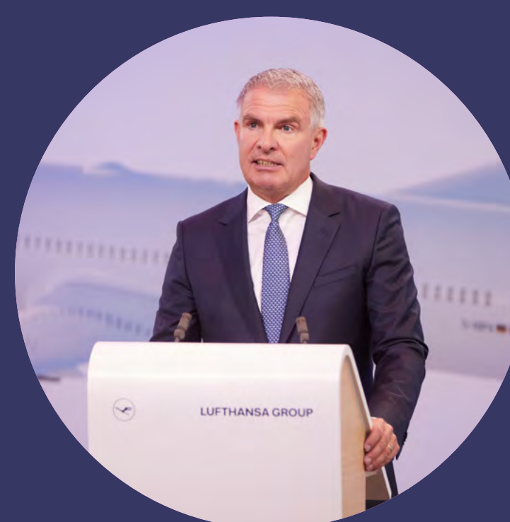
CARSTEN SPOHR, Vorstandschef der Lufthansa AG bei der diesjährigen Hauptversammlung am 10. Mai

»Nach zwei Jahren Pandemie lassen wir die Krise heute mental hinter uns und blicken gestärkt in die Zukunft. Dabei ist uns natürlich bewusst, dass wir die finanziellen Folgen noch lange nicht bewältigt haben. Die zusätzlichen Schulden werden uns noch Jahre beschäftigen.«