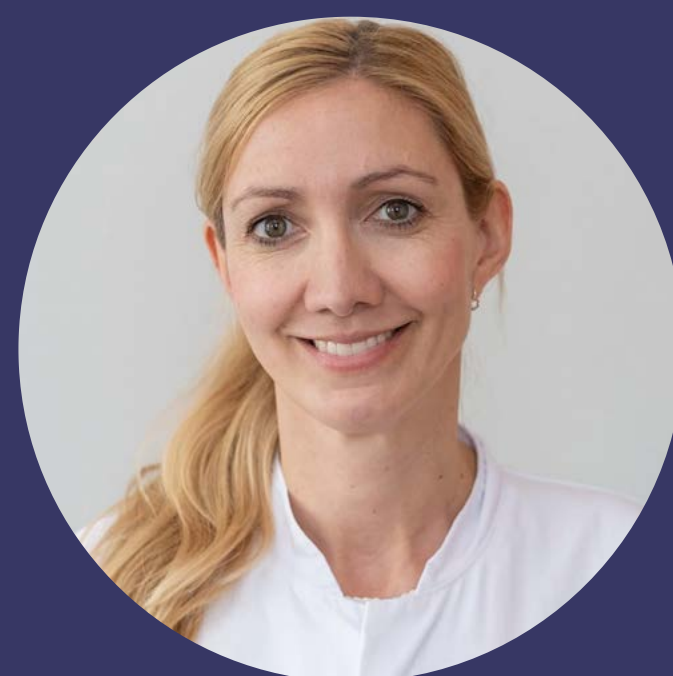
SANDRA CIESEK, Leiterin der Virologie des Universitätsklinikums Frankfurt im neuen NDR-Podcast

»Wenn man sich anschnallt und einen Airbag hat, dann ist das das, was man machen kann und ein guter Schutz. Aber wenn ich mit Hundert gegen eine Mauer fahre, wird mir das auch nichts nutzen.«