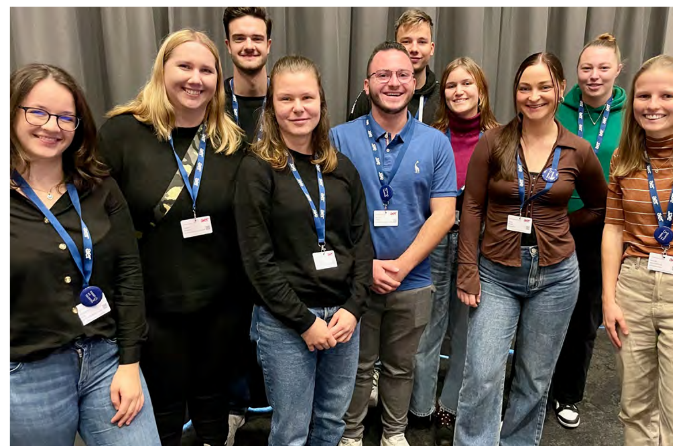
TOP-NEWS DER WOCHE