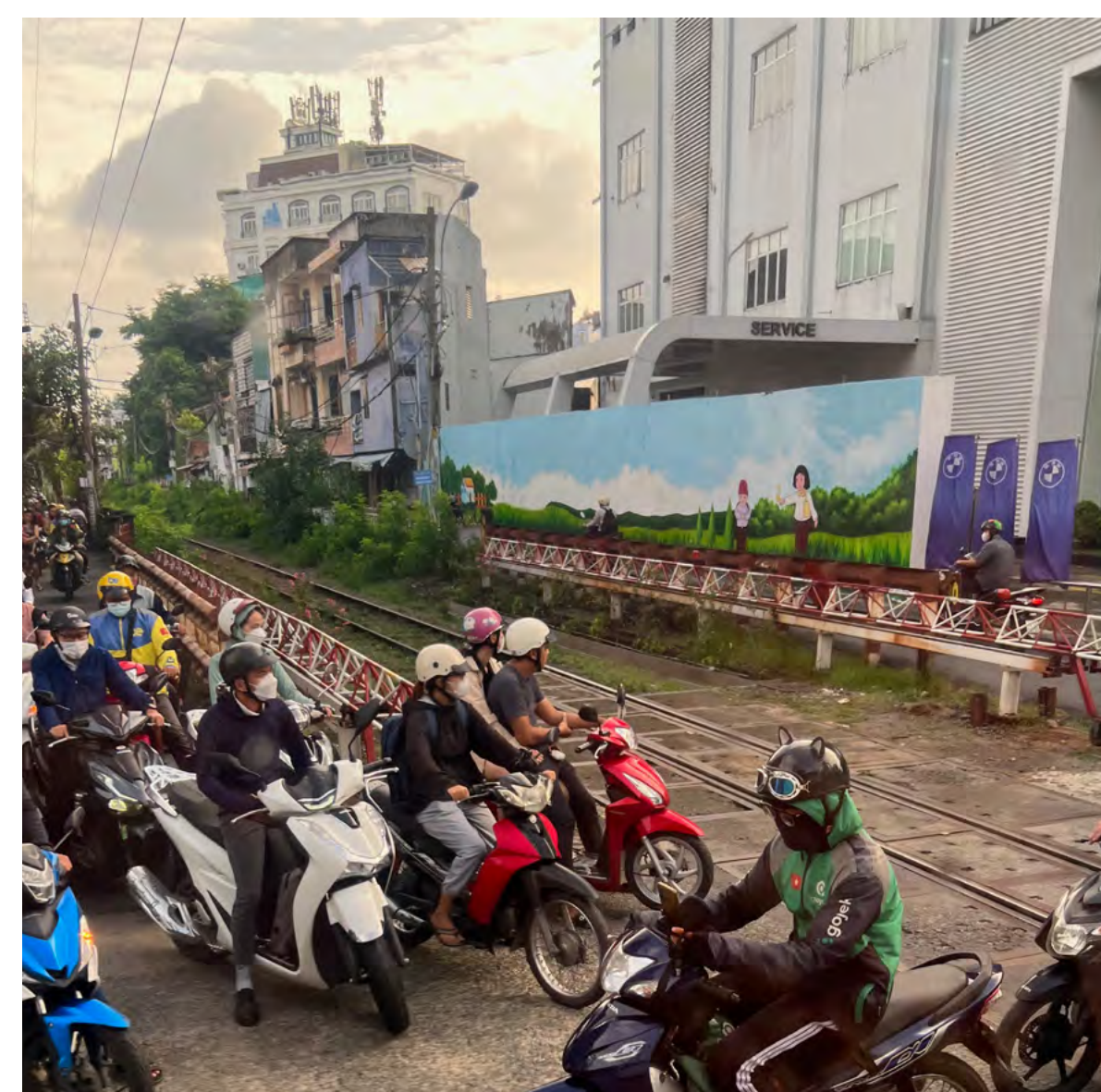
Wiedervereinigungsexpress: Auf dieser unscheinbar wirkenden Strecke fährt der Zug in 36 Stunden von Saigon nach Hanoi. Die Bahnstrecke des damaligen „Transindochinois“ wurde unter der französischen Kolonialherrschaft von 1899 bis 1936 gebaut.