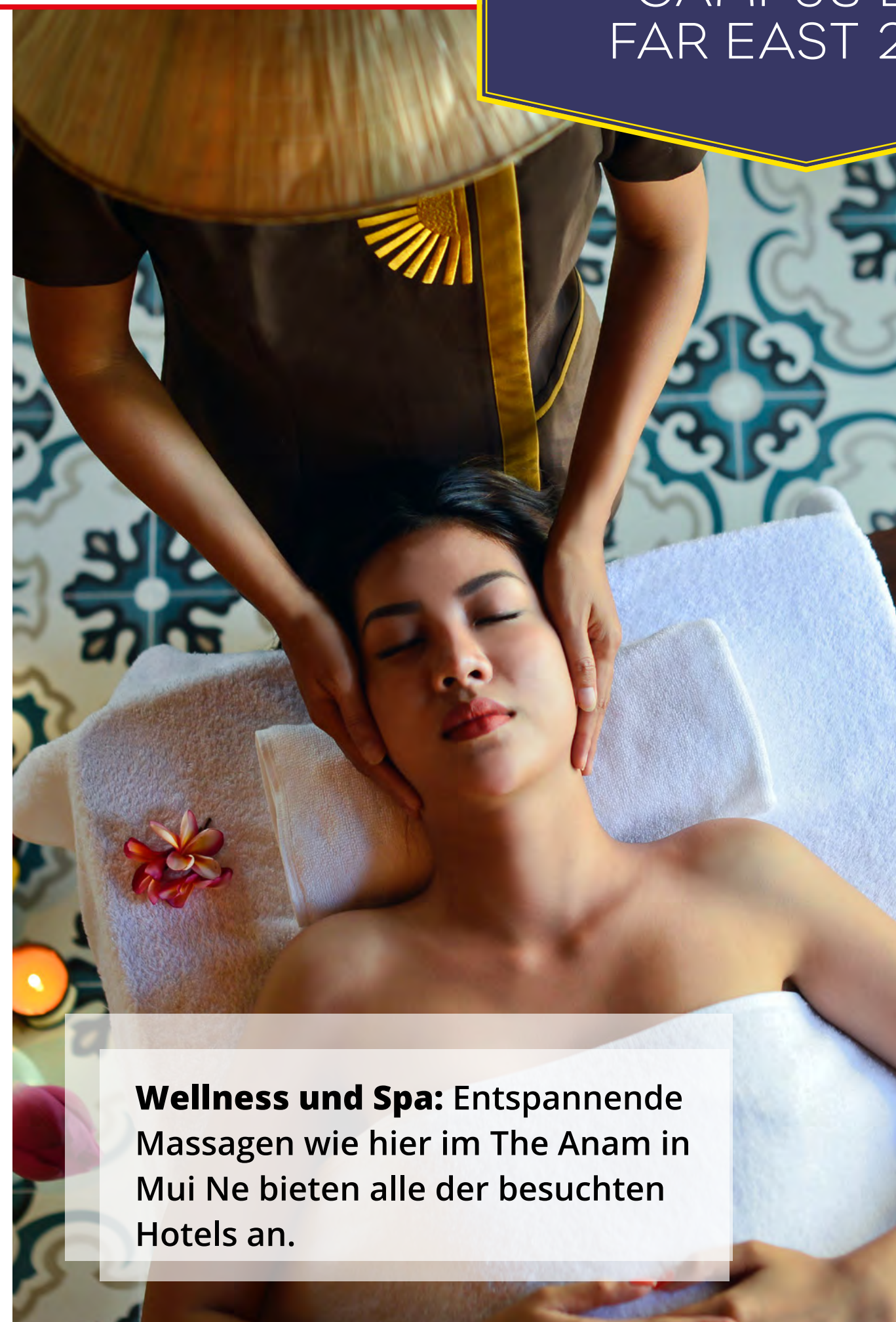
Wellness und Spa: Entspannende Massagen wie hier im The Anam in Mui Ne bieten alle der besuchten Hotels an.

Mehr Infos zu Vietnam, den Stimmen der Expis sowie exklusive Fotos zur Campus LIVE Far East 2023 gibt es in unserem nächsten Printmagazin TRVL Counter QUARTERLY Mitte Dezember!