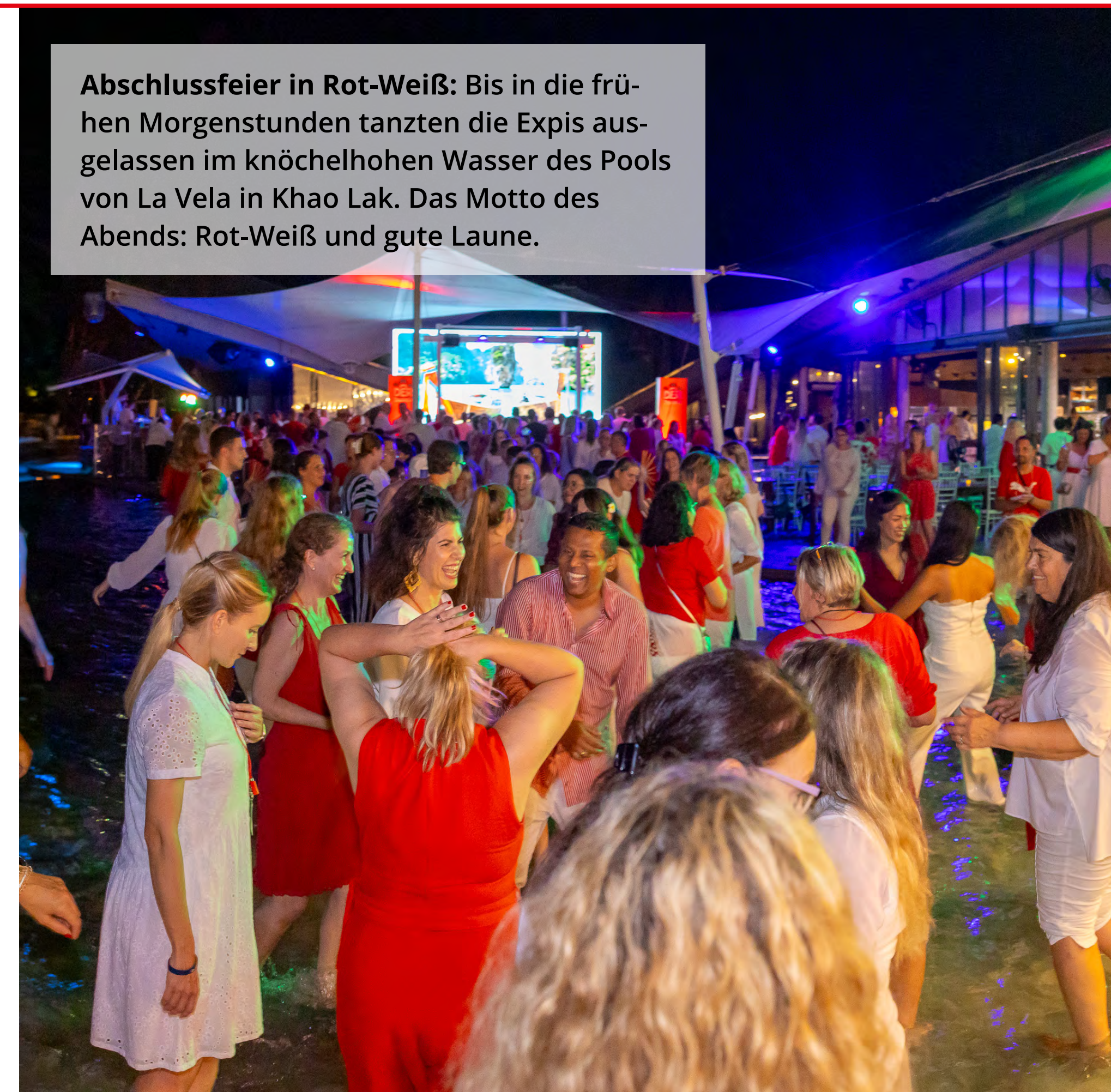
Abschlussfeier in Rot-Weiß: Bis in die frühen Morgenstunden tanzten die Expis ausgelassen im knöchelhohen Wasser des Pools von La Vela in Khao Lak. Das Motto des Abends: Rot-Weiß und gute Laune.