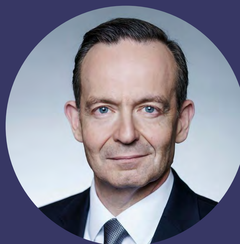
BUNDESVERKEHRSMINISTER VOLKER WISSING, zur aktuellen Situation der Deutschen Bahn Zum Artikel

»Es reicht ja nicht Zahlen in die Welt zu setzen, man braucht Lösungen. Es gibt in Deutschland ganz viele Problembeschreiber, was die Bahn angeht, aber es gibt zu wenige, die sich mit der konkreten Lösung beschäftigen. Ich sehe meine Aufgabe darin, ganz konkret Dinge umzusetzen.«