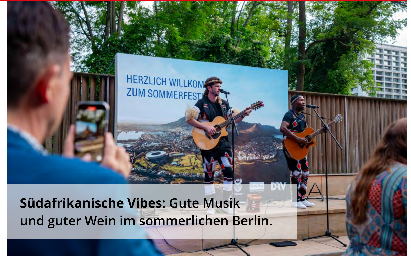
Südafrikanische Vibes: Gute Musik und guter Wein im sommerlichen Berlin.